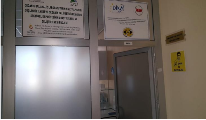
Şekil 2. Bal Analiz laboratuvarları