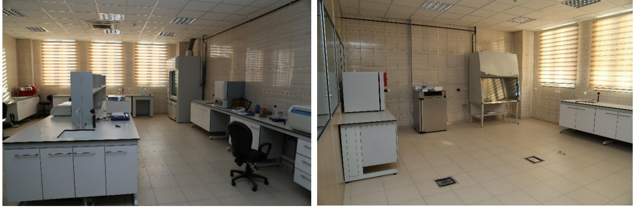
Şekil 5. Moleküler ve Mikrobiyoloji laboratuvarları